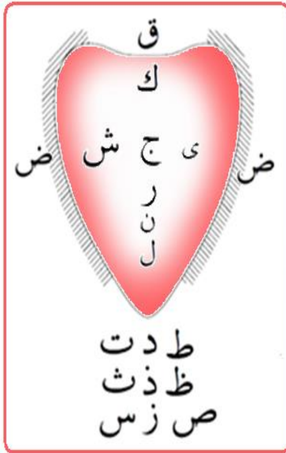
Huruf yg keluar dari Lidah